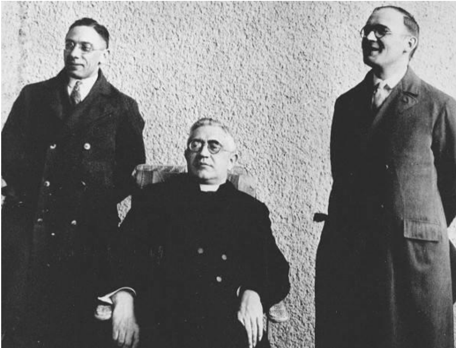
Nikolaus Groß (*30.09.1898) Verbandsleiter der KAB † 23.1.1945 Hinrichtung in Berlin-Plötzensee